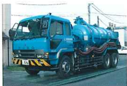
②作業用特殊吸引車の出動