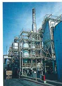
⑥工場での無害化作業