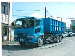
⑦コンテナ専用車で最終処分場へ