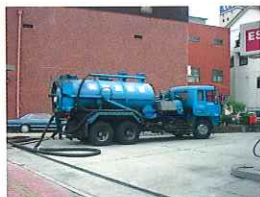
③吸引車による吸引作業