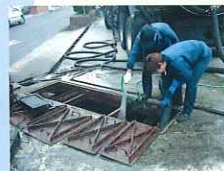
④当社作業員による分離槽の清掃作業

適正価格の料金には、収集運搬費・清掃作業費・中間処分費・最終処分地持込費用などが含まれております。