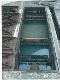
①清掃前の油水分離槽

喜楽の処理は、槽の清掃だけでは終わりません。 汚泥等の無害化まで適正に処理いたします。